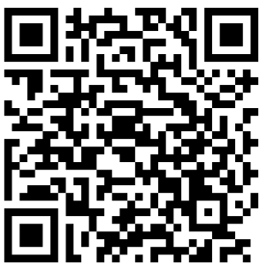
【新聞稿】KKCompany 榮獲全台首張 OpenChain

《ISO/IEC 5230》是一個標準文件，它描述了一種軟體供應鏈的管理體系，旨在協助組織在複雜的軟體開發環境中有效地管理與控制開放原始碼軟體的使用和交付。該標準提供了一套方法，幫助組織確保軟體供應鏈中的所有參與者都遵守了相關的法律、法規和授權要求，同時確保軟體的合法性、可信度和可持續性。